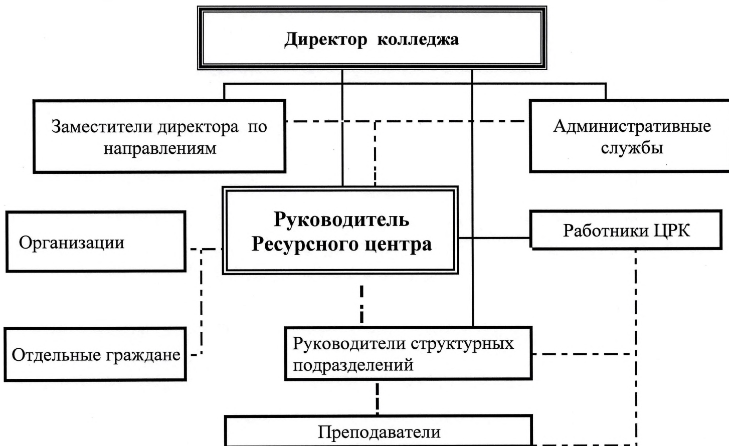
Схема 1. Структура управления и взаимодействия руководителя Ресурсного центра