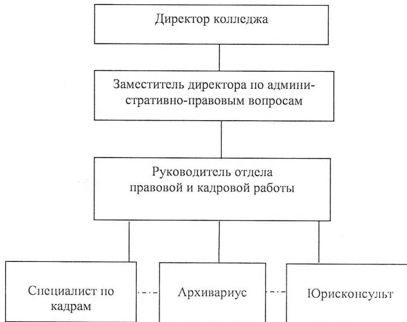
Схема внутренних связей отдела кадров