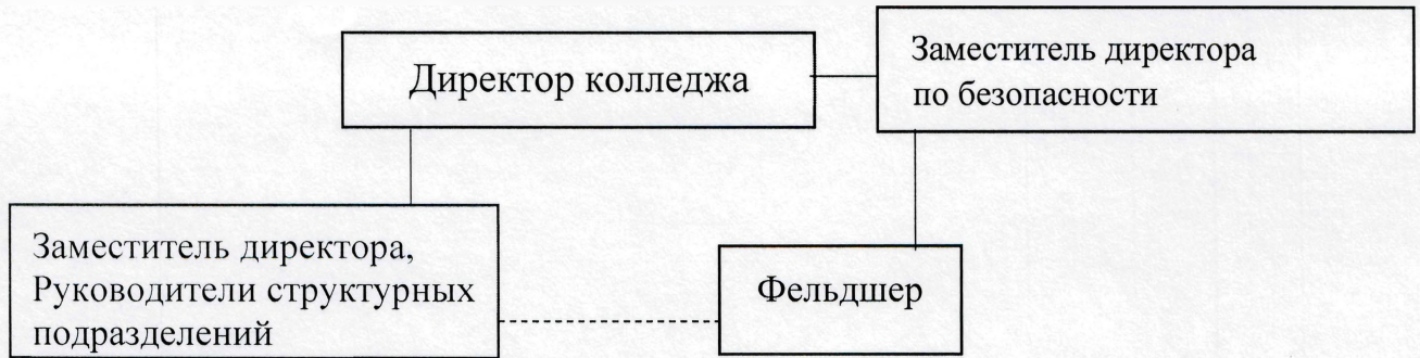
Схема 1. Управление деятельностью по охране здоровья студентов и работников колледжа.